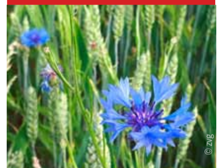
Alle eure Dinge lasst in der Liebe geschehen. 1. KOR. 16, 14