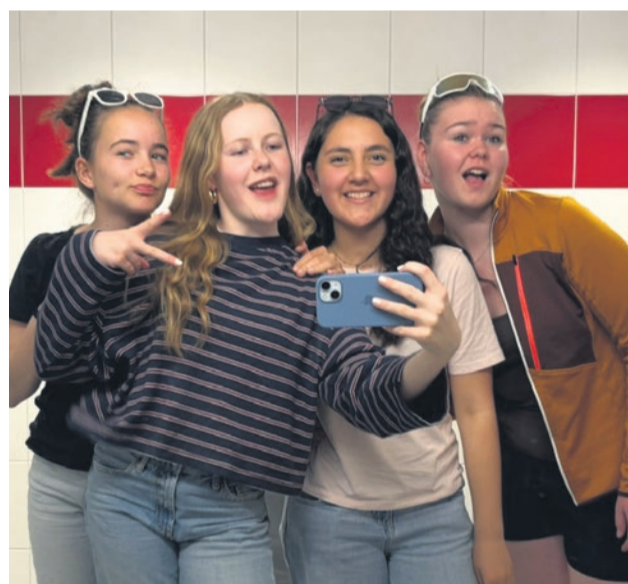
Vier zufriedene Damen!

Tobias zum Konf.-Lager: «Ich habe gelernt, dass das Auswählen des Konf.-Themas nicht das einfachste ist ...»