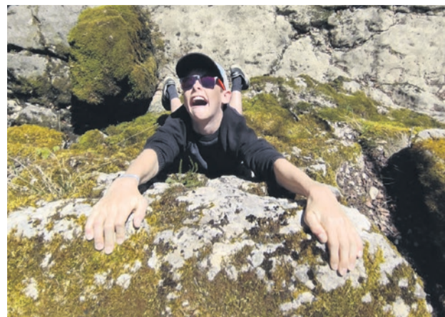
Jans Kampf mit dem Felsen