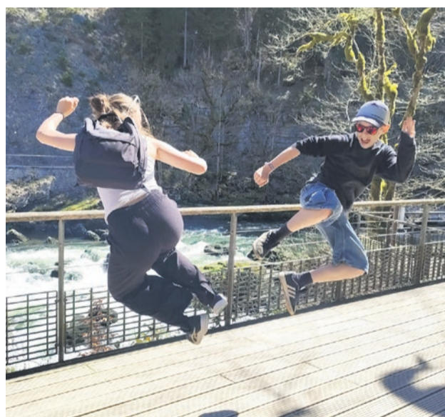
Luftkampf am Lac des Brenets