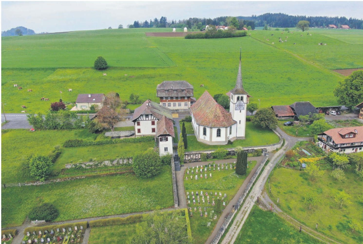
Die Maschine eröffnet uns eine neue Perspektive: die Kirche Zimmerwald, aufgenommen von einer Drohne

LAYOUT merkur medien ag, Langenthal | reformiert@merkurmedien.ch