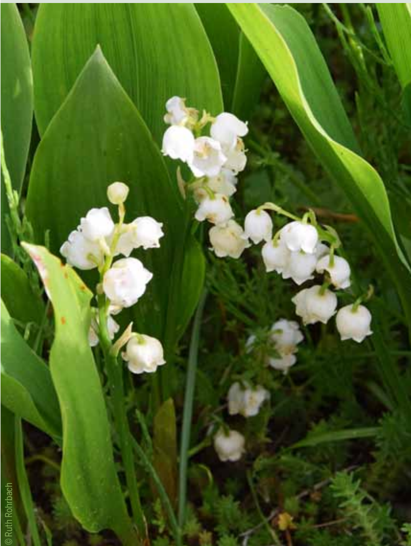
GOTTESDIENSTE IM MAI