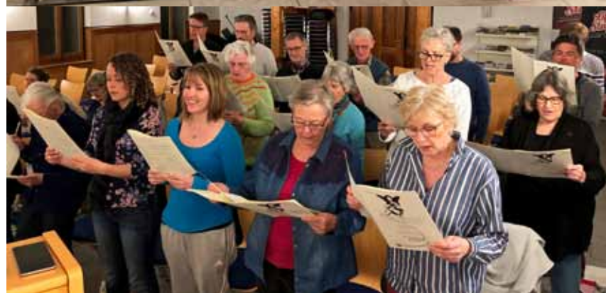
Oben: Kirchenchöre der KG Oberbalm und der EMK Schlatt bei der Probe.