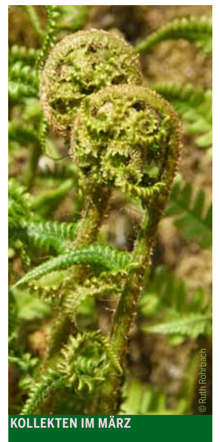
KOLLEKTEN IM MÄRZ