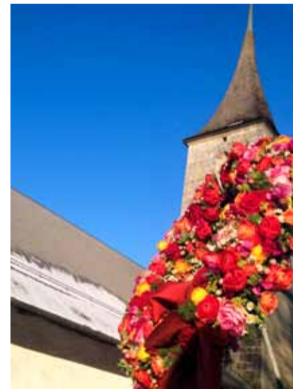
TEXT: PFR. MARKUS REIST, OBERBALM

«Möge dann und wann deine Seele aufleuchten im Festkleid der Freude. Möge dann und wann ein Lied aufsteigen vom Grunde deines Herzens, um das Leben zu grüssen wie die Amsel den Morgen. Möge dann und wann der Himmel über deine Schwelle treten.»