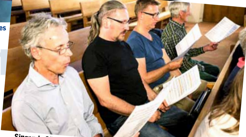
Singende Sängerinnen und Sänger an der Probe vom 29. Mai