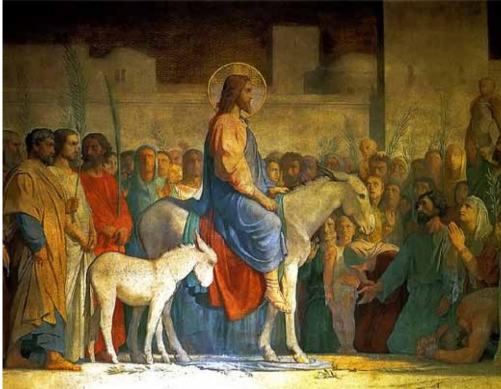
Christi Einzug in Jerusalem, Hippolyte Flandrin, 1842