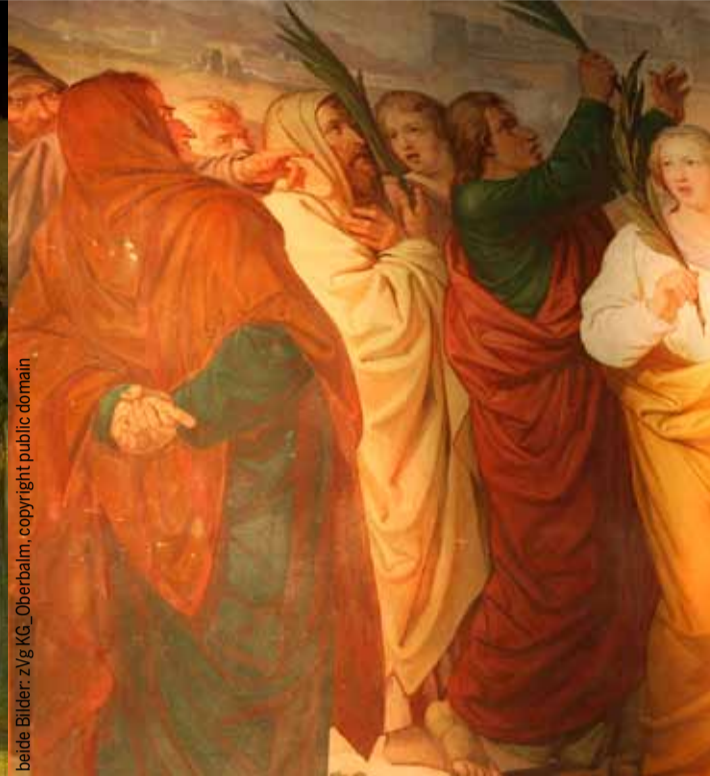
Wandgemälde in der Tiroler Pfarrkirche von Zirl