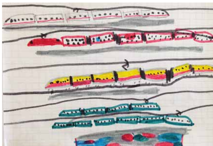
Zeichnung: Sem Herren

Bei der biologischen Entwicklung des Sehens stand am Anfang ein sehr einfaches Hell-/Dunkel-sehen. Dass Einzellern und Würmern zur besseren Orientierung im Raum diente. Dieses Sehen ist digital, es ist nämlich entweder Hell oder Dunkel, Schwarz oder Weiss, 0 oder 1. Heute leben wir immer mehr in einer mehrheitlich digital geprägten, berechneten und vermessenen (!) Welt von Bits und Bytes. Dies dank der Entwicklung von Informationstechnologien durch immer perfektere Computer. Das Wort Computer bedeutet dabei nichts anderes als Rechner. Und so neigt denn auch unsere Weltbetrachtung heute sehr oft zum Berechnen und