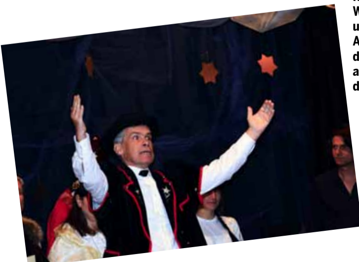
Unter dem Motto «Als das Wünschen noch geholfen hat» stand auch das Weihnachtssingspiel 2015 im Wohnheim Riggisberg. Auf eindrückliche Weise haben Bewohnerinnen und Bewohner Wünsche zum Ausdruck gebracht, insbesondere auch den Wunsch, dass alle Menschen wissen, warum dass wir Weihnachten feiern.