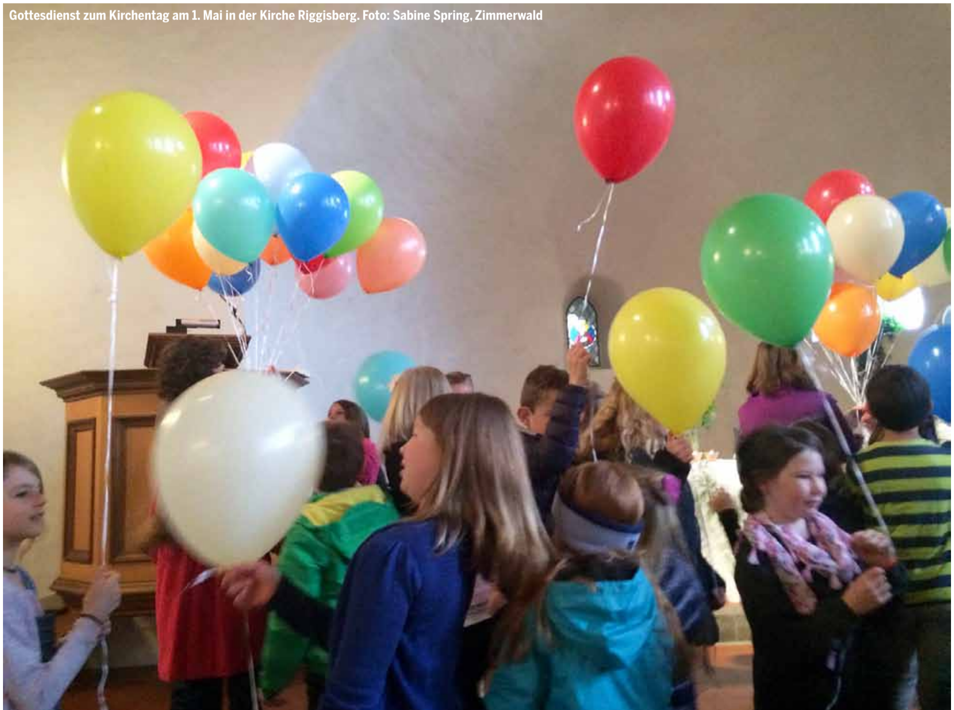
Gottesdienst zum Kirchentag am 1. Mai in der Kirche Riggisberg.